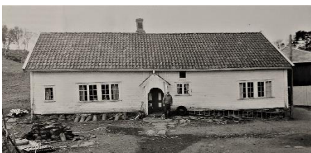
Huset i Åsen er det eldste heimehuset i Bjerkreim, første byggetrinn fra 1710. 1979.