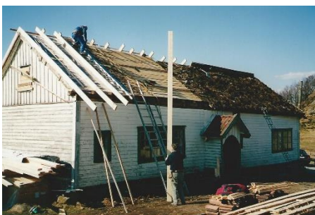
Restaurering av Åsenhuset 2002-2007.